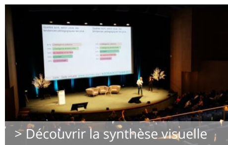
> Découvrir la synthèse visuelle

Denis CRISTOL , en qualité de grand témoin, a animé la conférence de clôture. Ce moment de synthèse a mis en perspective l'ensemble des productions et des échanges résultant de l'événement. Son intervention a permis de restituer, avec justesse, la richesse des apports et des échanges des deux jours.